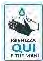
FM00 Dimensione 210 x 297 in alluminio "IGIENIZZA QUI LE TUE MANI"