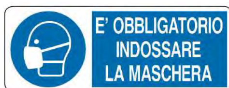
* 3408A Dimensione 333 x 125 in alluminio * 3408B Dimensione 333 x 500 in alluminio